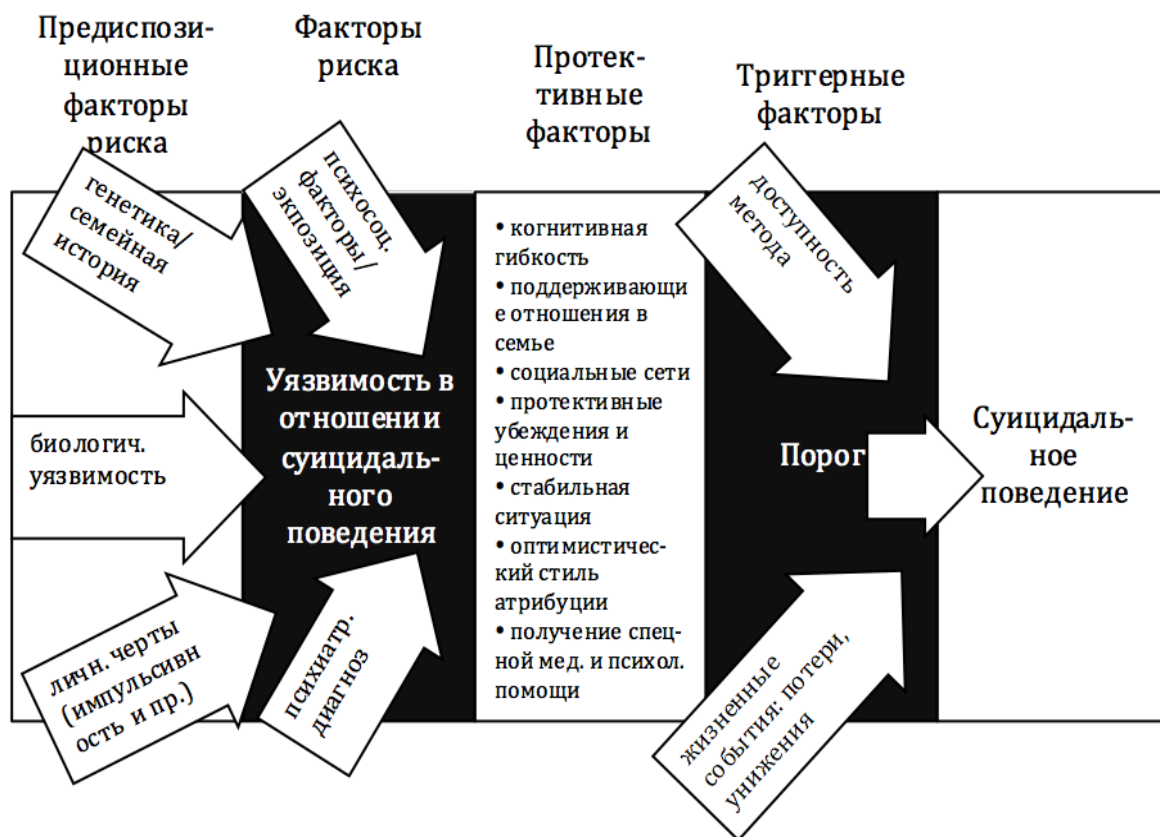
Рисунок 2. Модель факторов риска и протекции по Blumenthal, Kupfer, 1988

разработанных специально по отношению к подростковому возрасту Дж.Блументаль и Д. Купфером (главы рабочей группы по разработке DSM-5), схематически представлена на схеме, приводимой ниже.