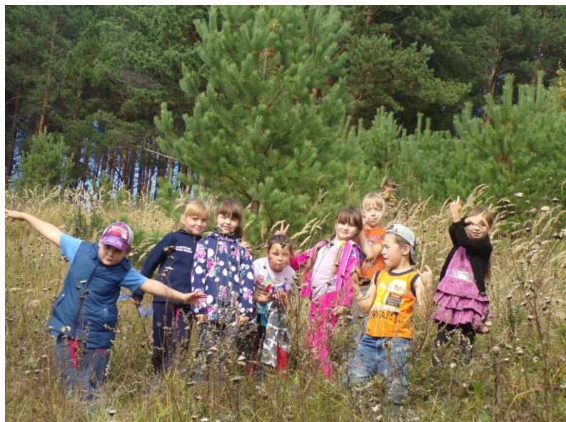
Участие в муниципальном конкурсе «Марш парков»